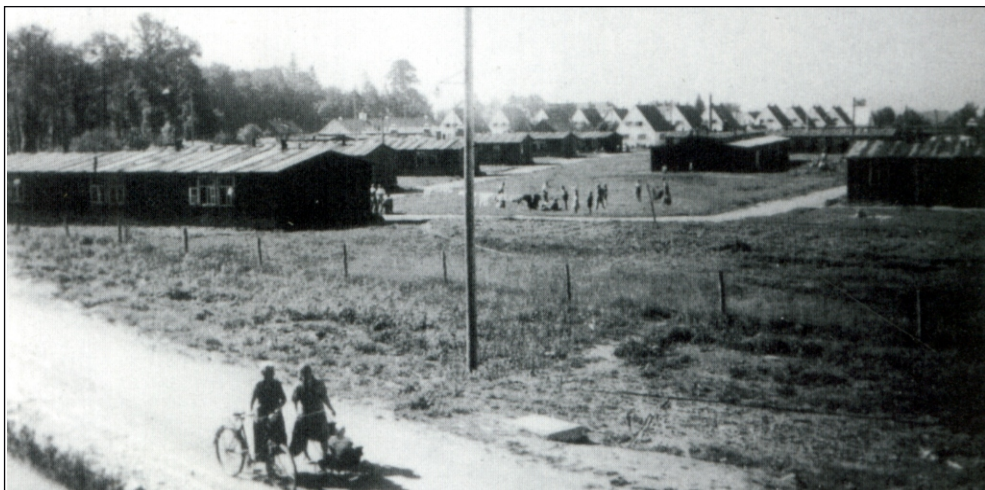
Blick auf das Barackenlager Zech im Jahre 1946.